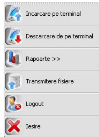
Activl BO Lite

Fiecare organizație deține o mare parte a resurselor sale financiare investită în mijloace fixe, de aceea controlul riguros al acestora reprezintă una din cheile succesului acesteia.